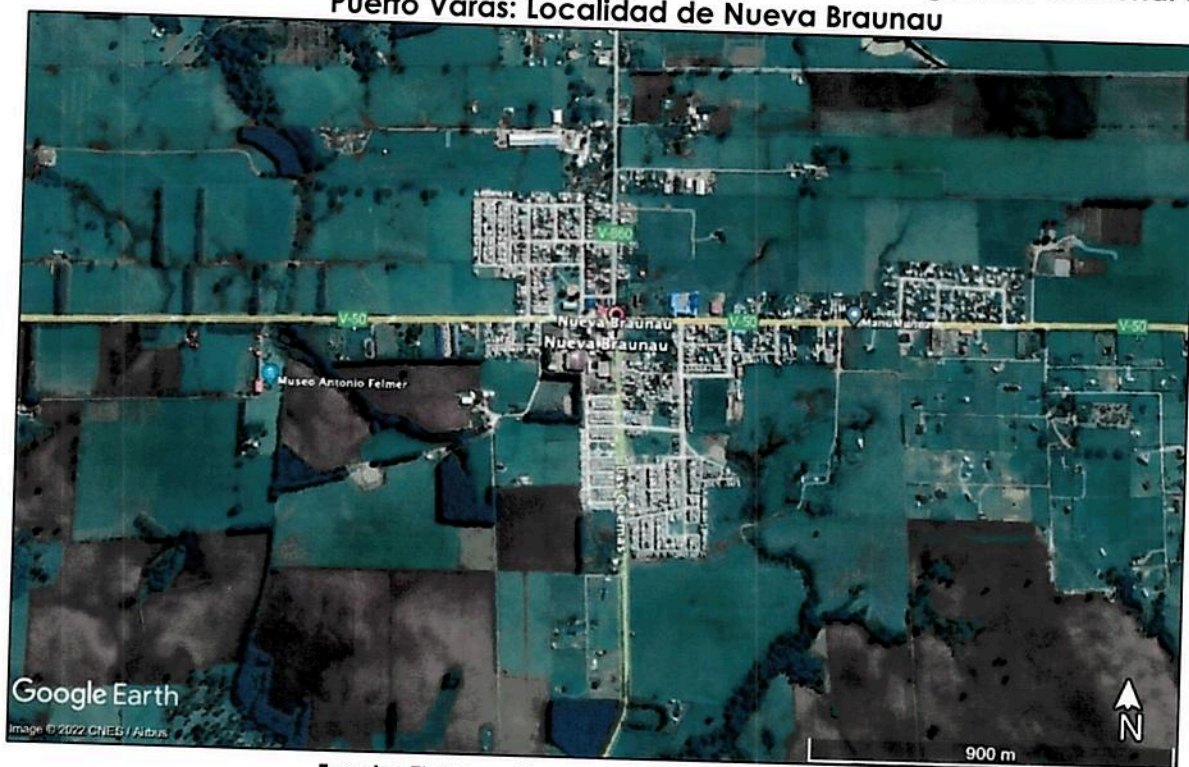
Figura 2. Ámbito de aplicación territorial Modificación Plan Regulador Comunal de Puerto Varas: Localidad de Nueva Braunau